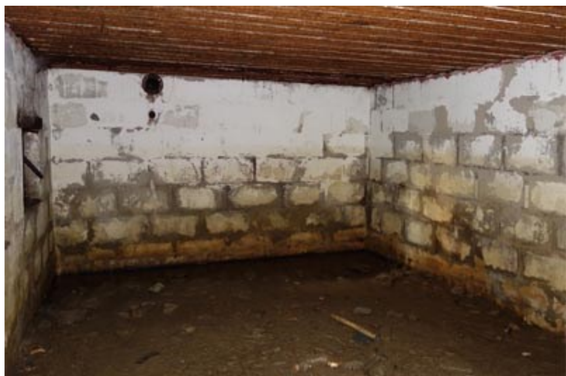
Intérieur d'une salle