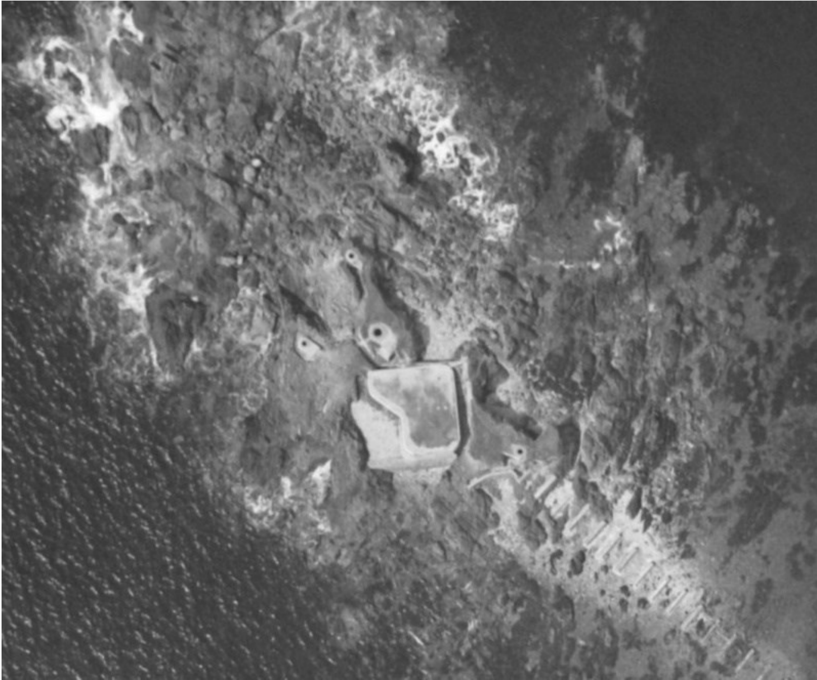
Photo aérienne 1945

Sur la plage de Tenez, se tient l'Île Percée qui est aménagée en mini forteresse.