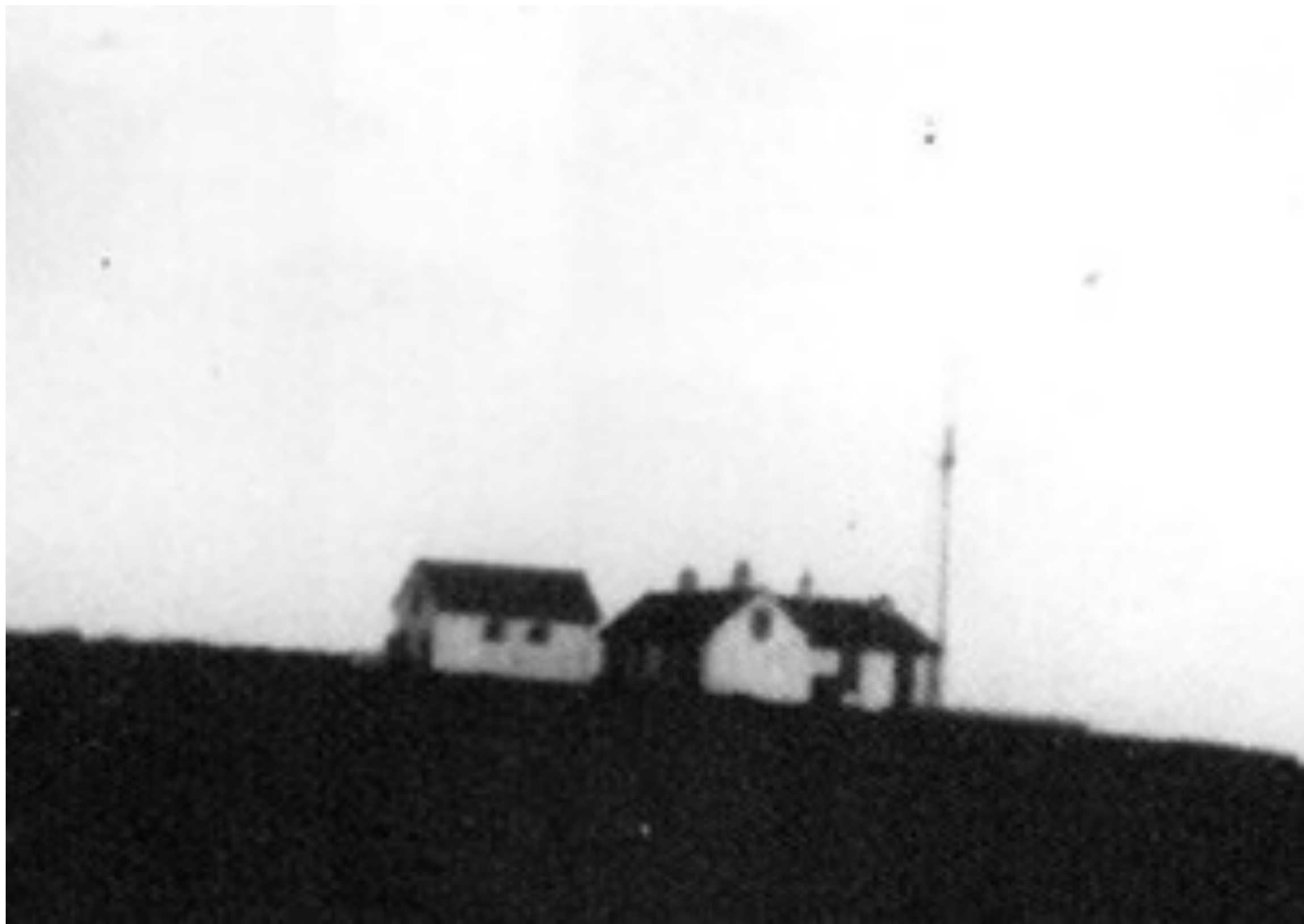
Le sémaphore en 1939

L'ancien sémaphore de Beg-Moch est détruit par les Allemands, qui établissent à sa place un poste de veille, avec un petit corps de garde.