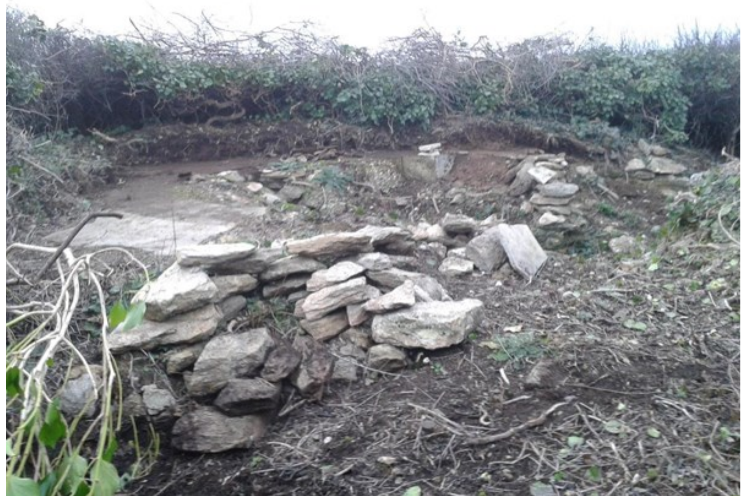
Vestiges de l'ancien sémaphore