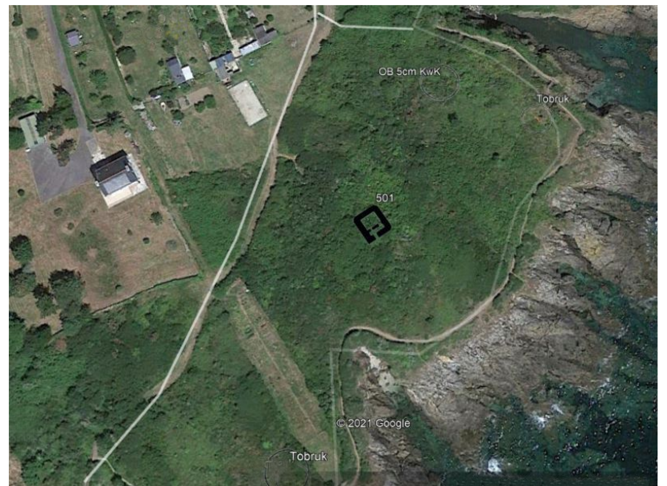
Photographie aérienne de 1966 – Emplacement des bunkers et tobrouks