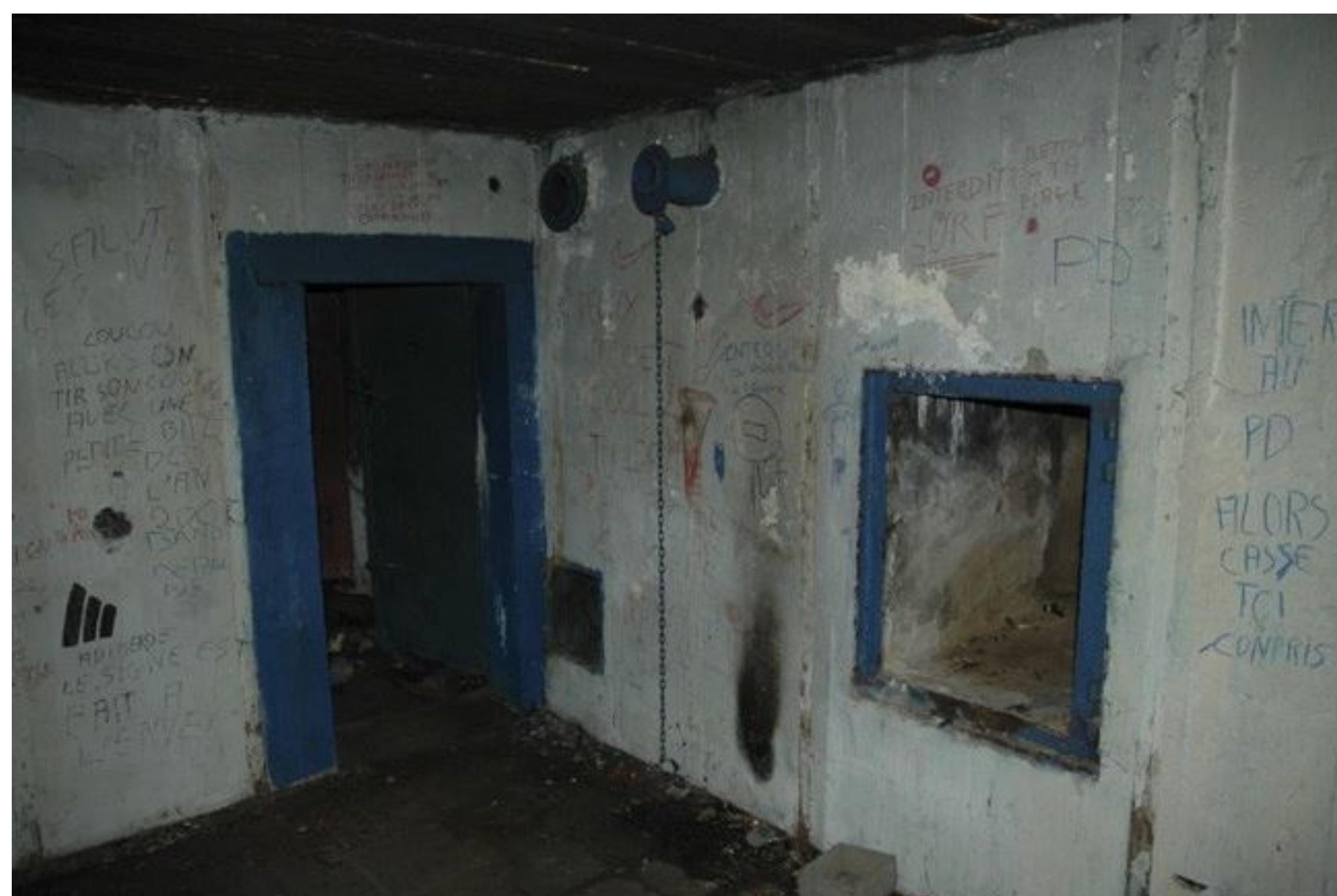
Intérieur du bunker

Le quai du port était couvert par une tourelle de char R 35 montée sur tobrouk.