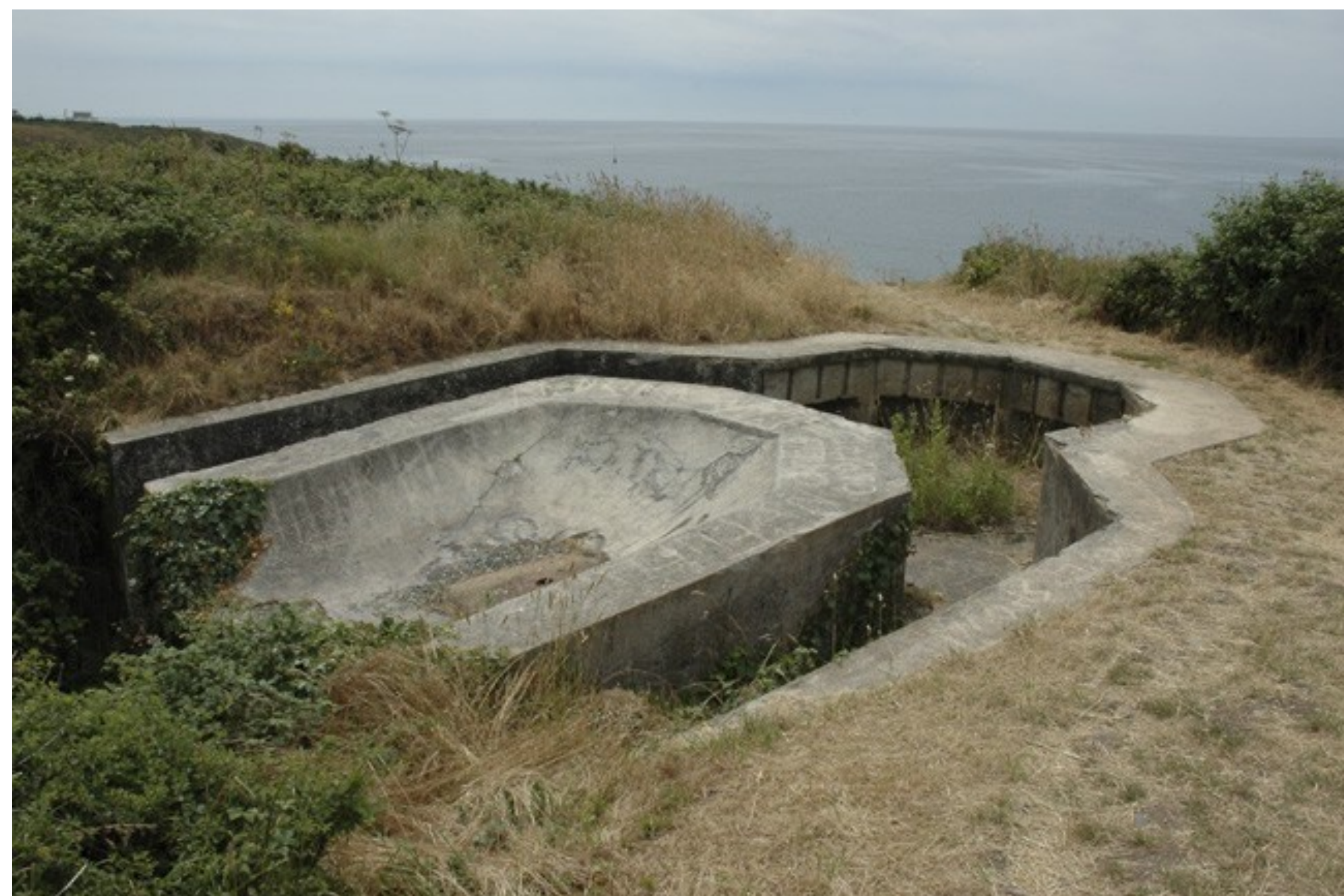
Le bunker aujourd'hui

Des tobrouks pour mitrailleuses complétaient la position.