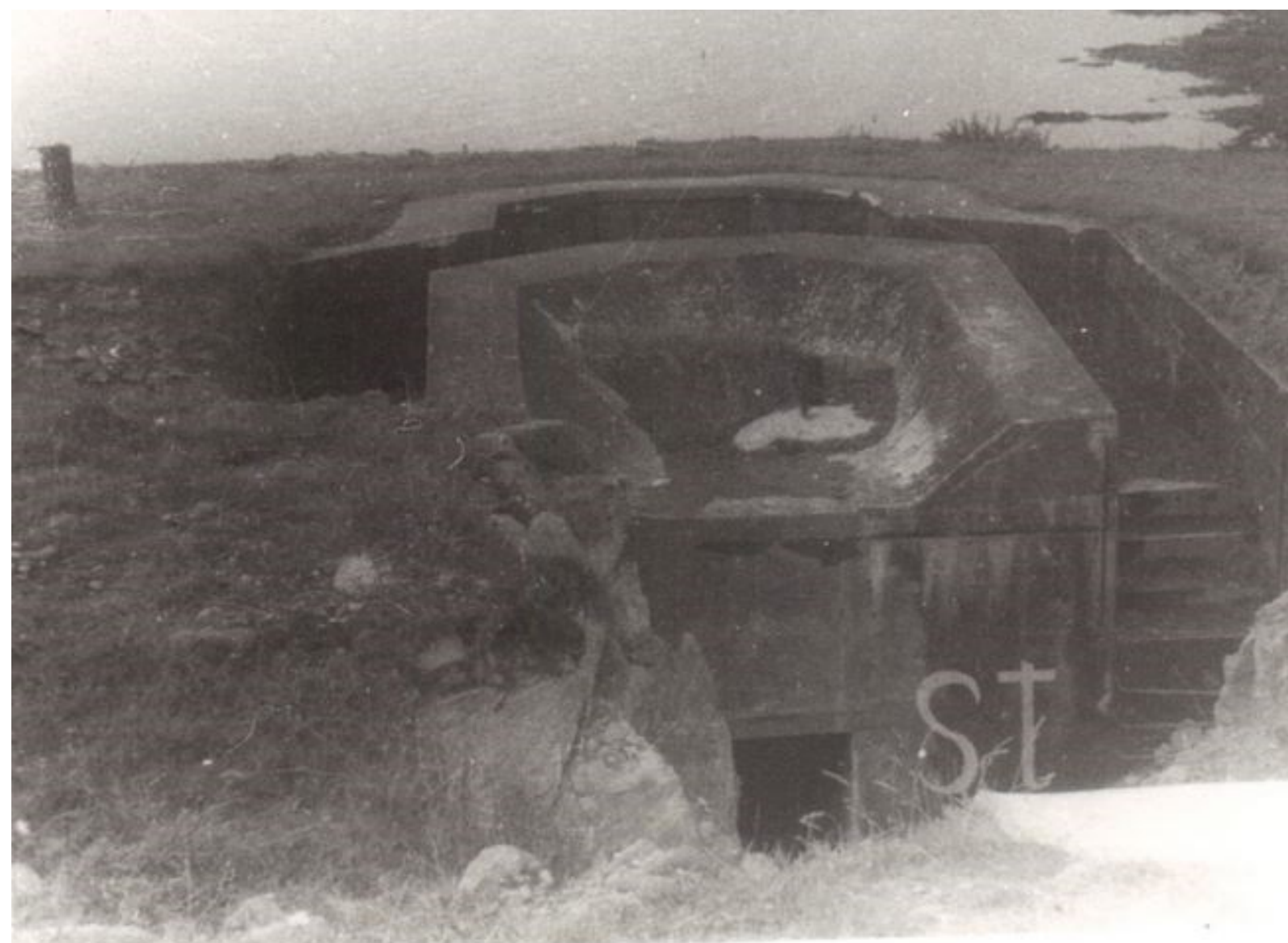
Le bunker en 1945