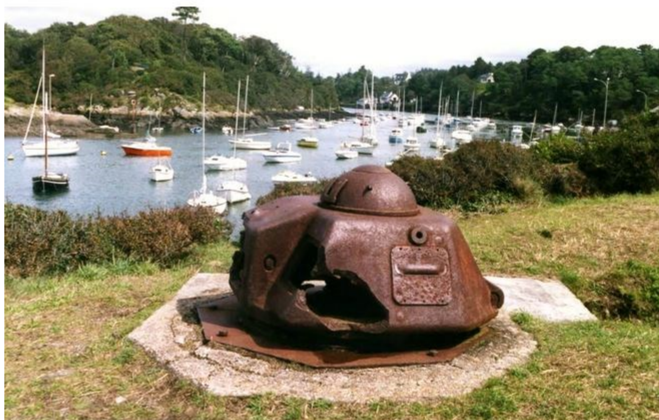
Tourelle de char 35 Renault APX

Un observatoire sur le point culminant marquait le centre des fortifications, et des baraquements en planche servaient de caserne.